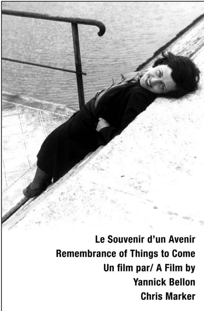
Le Souvenir d'un Avenir Remembrance of Things to Come Un film par/ A Film by Yannick Bellon Chris Marker