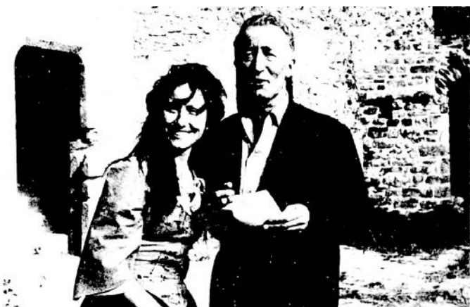
ZA KLODA (Claude Roy, 1915–1997) i LOLE (Loleh Bellon, 1925–1999)