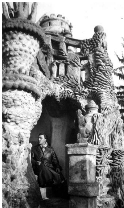
A. Breton, Palais idéal, 1931. Les Vases communicants , izdanje iz 1955.

( Fotografije anatomskih modela, zatim opet snimci Idealne palate. )