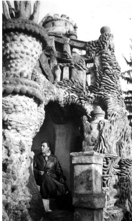
A. Breton, Palais idéal, 1931. Les Vases communicants , izdanje iz 1955.

( Fotografije anatomskih modela, zatim opet snimci Idealne palate. )