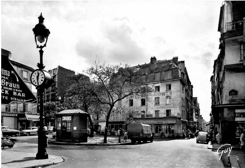
Trg Kontreskarp, oko 1950.

Na razglednici, u donjem desnom uglu, zaista piše „Guy“.