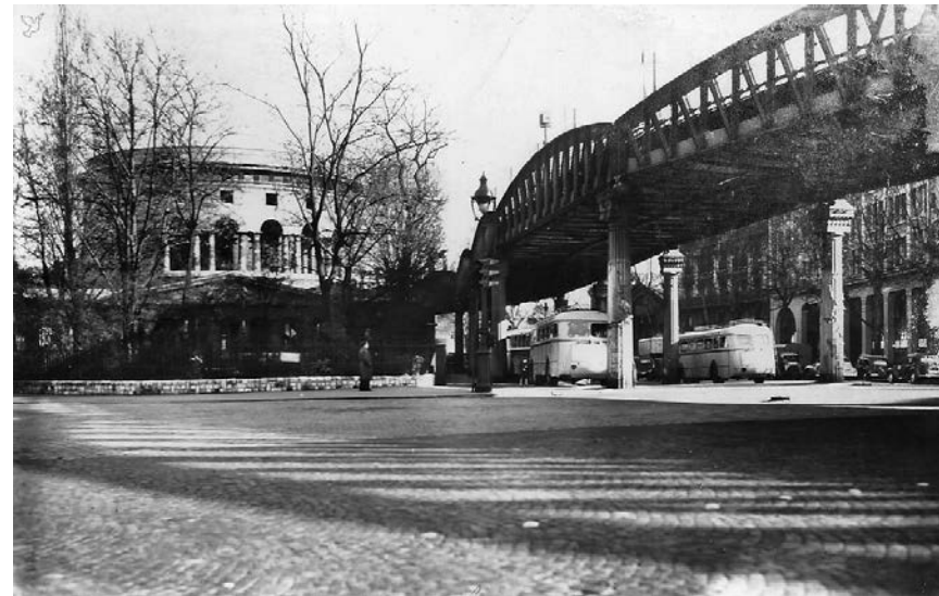
Trg Staljingrad i Leduova rotonda.

do kanala Deni (Saint-Denis), idu njegovom desnom obalom, dalje na sever, zaustavljajući se, na duže ili kraće, u raznim barovima koje drže ljudi s barži. Odmah kod mosta Landi (Landy), odvajaju se od kanala, kod poznate brane, i u 6.30 predveče stižu u španski bar, koji tamošnji radnici zovu „Kafana bundžija“, u najzapadnijem delu Obervilije, tačno preko puta mesta zvanog „Poljanče“ („La Plaine“), koje pripada opštini (Sen-) Deni. Pošto su još jednom prošli pored brane, tumaraju neko vreme Obervilijeom, kojim su noću prošli najmanje deset puta, ali koji im je po danu nepoznat. S prvim mrakom, odlučuju da prekinu ovaj prolazak, koji im više nije zanimljiv.