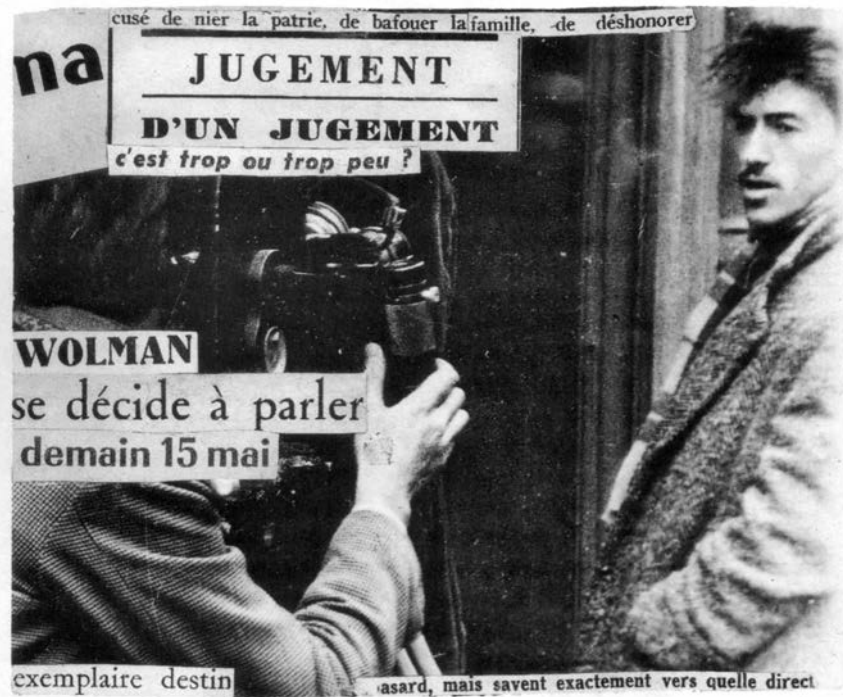
Guy Debord, Portrait Žila Ž Volmana , 1954.

Među tolikim temama kojima se bavimo, sa ili bez pravog zanimanja, nasumična potraga za novim načinom života jedino je što u nama može da uzburka strasti. Estetske i druge discipline pokazale su se krajnje nepodesnim u tom pogledu, tako da ne zavređuju našu pažnju. Zato bi trebalo definisati neke privremene oblasti istraživanja – između ostalog, istraživanje slučajnih i predvidljivih oblika ponašanja na ulici.