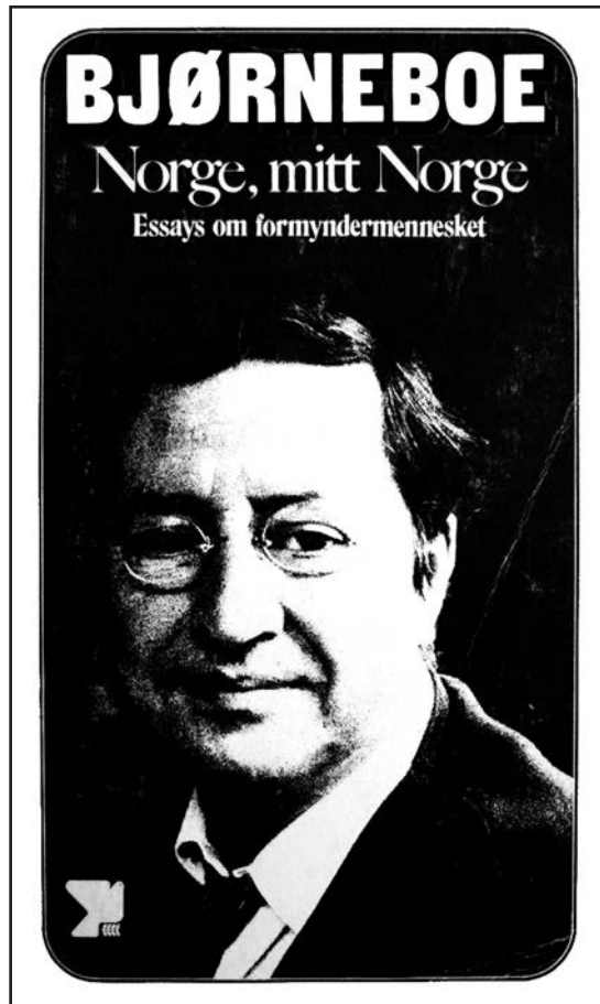
Zbirka eseja Norveška, moja Norveška , iz 1968, u kojoj je ovaj tekst bio ponovo objavljen, kao prvi od četiri eseja posvećena Americi.

ku američku mašinu. Oni su drugačije izrade. Često su siromašni, a u očima nose ono čudno beskućništvo, koje govori da se cela jedna generacija, cela nova vrsta ljudi našla u pokretu. To više nisu „nedužni stranci“ – oni nisu iz inostranstva, zato što nemaju domovinu. Najviše ih ima u starim kulturnim centrima i dobrovoljno se odriču svega što Amerika ima da im ponudi, samo ako mogu da provedu još jednu zimu u Firenci, Rimu ili Parizu. Što je neki grad stariji, to će lakše u sebe usitati ljudi izgadnede zbog nedostatka istorije. Tragedija je u tome što ti vitezovi Svetlog grala tragaju za nečim u Nemačkoj, Italiji i Francuskoj, u zemljama svojih dedova, u trenutku kada se ostaci evropske kulture nalaze na pragu zaborava. Ljudi lišeni istorije, tragaju za svojom prošlošću na kontinentu koji je i sam na ivici da postane aistorijski.