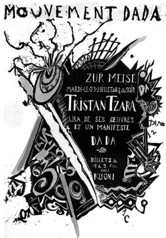
M. Janco, plakat za Osmo večje DADA, na kojem je Cara predstavio svoj Manifest dade 1918 . Cirihi, 29. VII 1918.

možemo proceniti pravu vrednost negativne, književne dade, uporedo s proročkim ostvarenjima pozitivne dade, koja je za umetnost otvorila nove puteve, na koje se, ako ništa drugo, umetnička kreativnost oslanja i danas.