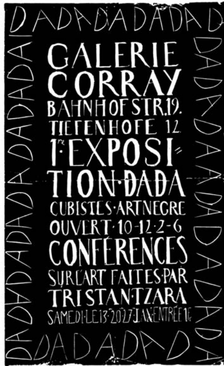
Plakat, M. Janco, 1917.

Upravo u tom trenutku, Bal se vratio na scenu i spasio dadu, tako što je otvorio Galeriju Dada (Galerie Dada, prethodno Galerie Corray), u samom centru grada. Dadaisti su se izmirili između sebe i ponovo okupili, organizovali izložbe i zajedničke centre; ovog puta je tu bio i velikodušni doprinos najvećih stranih umetnika, koji nisu ak-