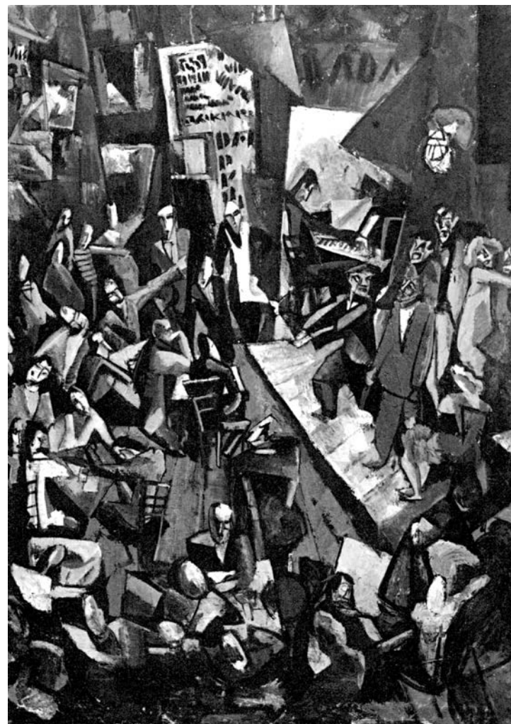
M. Janco, Cabaret Voltaire , 1916.