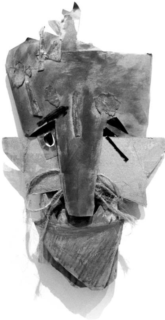
M. Janco, maska, c. 1917–1918.

Marcel Janco, „Dada à deux vitesses“, tekst napisan povodom pedesetogodišnjice dade i velike retrospektive priredene u Kunsthaus, Zürich (od 8. X – 17. XI 1966) i Musée national d'art moderne, Paris (od 30. XI 1966 – 30. I 1967).