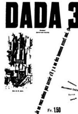
DADA 1–3, ilustracije, M. Janco, 1917–1918.

Dada traje. Ne toliko zbog eksperimenata i književnih ekscesa koji su vodili ka pojavi nadrealizma, koliko zbog ostvarenja proročkog duha, kao u delima Arpa, poeziji i slikarstvu Paula Klea, seriji živopisnih ilustracija Hansa Rihtera, Egelingovim i Rihterovim apstraktnim filmovima, našim pokušajima s muralima i apstraktnim reljefima, i predivnim tapiserijama Sofi Tojber.