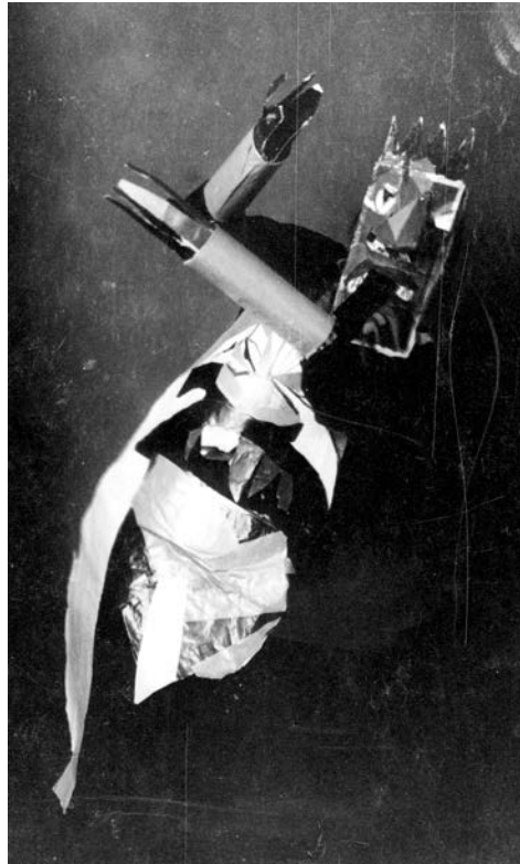
Sophie Taeuber, maska i kostim, M. Janco, 1917.

Da li je ona bila samo muza visokog sveštenika? Nikako. Svaki njen gest, svaki izraz njenog lica i duha odisali su nečim vrlo osobenim. U njenim radovima, koje nije često pokazivala, uvek je bilo novih ritmova, nekog iznenađujućeg ličnog naglaska, razigranih i geometrijski sinkopiranih izraza, kao u akordima dobrog džezza, ili suzdržane i dostojanstvene tuge dostojne američkog „bluesa“.