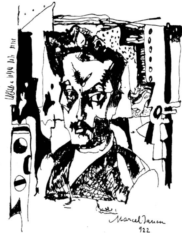
MARSEL JANKO Kreativna dada (1957) Dada u dve brzine (1966)