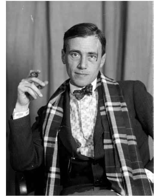
Hans Richter

Na jednoj od tih priredbi, prišao nam je neki simpatični mladić i predstavio se: „Rihter, Berlin.“ (Hans Richter) Izgledao je kao neki veliki biznismen ili sin milionera, ali ubrzo smo ga pročitani. Dao je svoj doprinos najnovijim dadaističkim publikacijama, ali je već osećao želju da učestvuje i