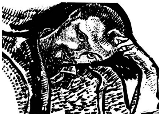
Paul Klee, autoportret, 1911.

bilo uokvireno crnom bradom, ali je opet izgledao kao veliko dete. Nije mnogo pričao i retko se pojavljivao među nama.