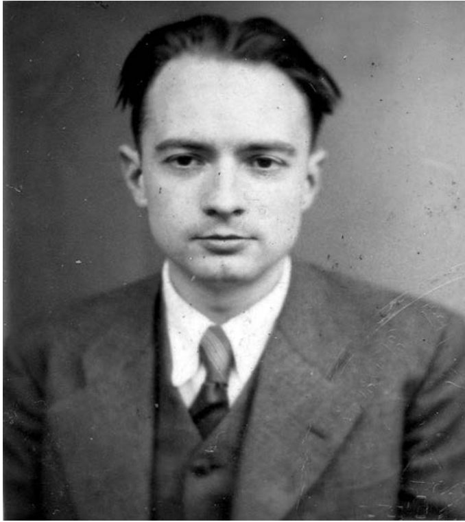
Jacques Ellul (1912–1994), Bordo, 1944.