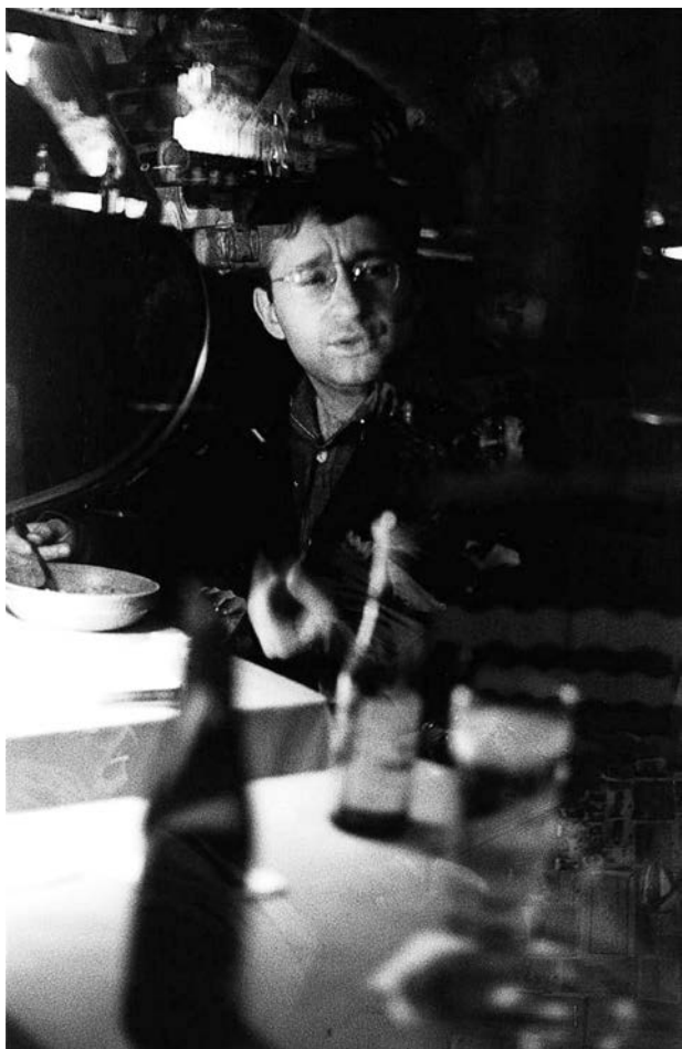
Guy Debord, Anvers 1962. Fotografija sa zadnjih korica prvog izdanja Društva spektakla (Buchet-Chastel, Paris, 1967).