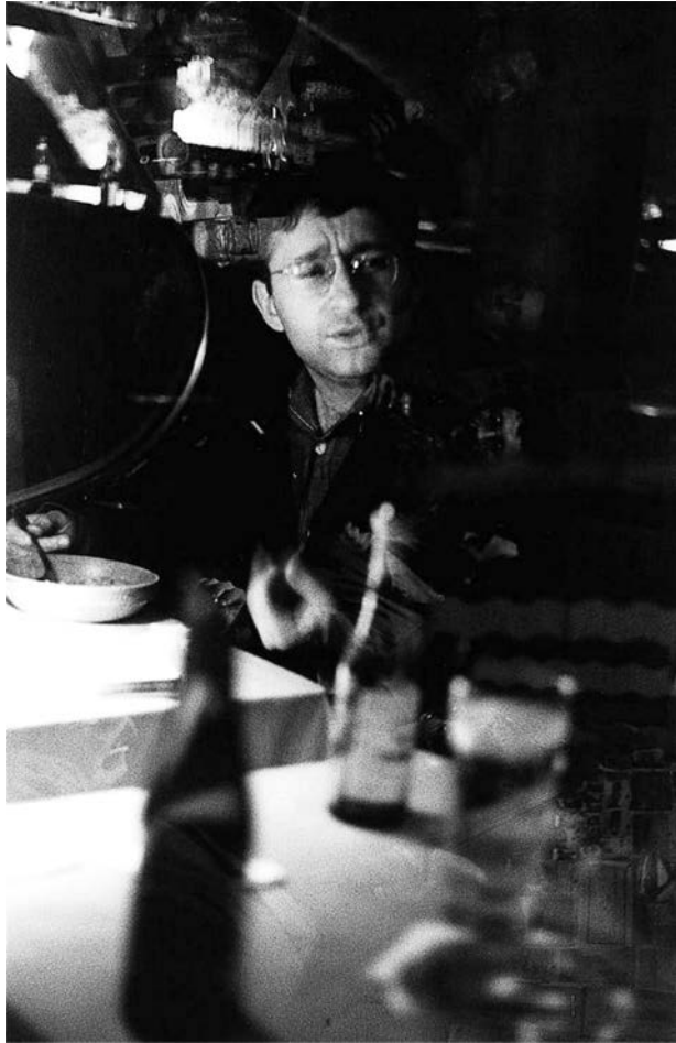
Guy Debord, Anvers 1962. Fotografija sa zadnjih korica prvog izdanja Društva spektakla (Buchet-Chastel, Paris, 1967).

„U sadašnje vreme, koje prednost daje znaku nad onim što je označeno, kopiji nad originalom, predstavi nad stvarnošću, pojavnosti nad suštinom... istinito se smatra profanim, a samo je iluzija sveta. Tačnije, sveto se uvećava u meri u kojoj istinito uzmiče, a iluzija pojačava, tako da najvišem stepenu iluzije odgovara najviši stepen svetosti.“ — Foerbah, iz predgovora za drugo izdanje Suštine hrišćanstva