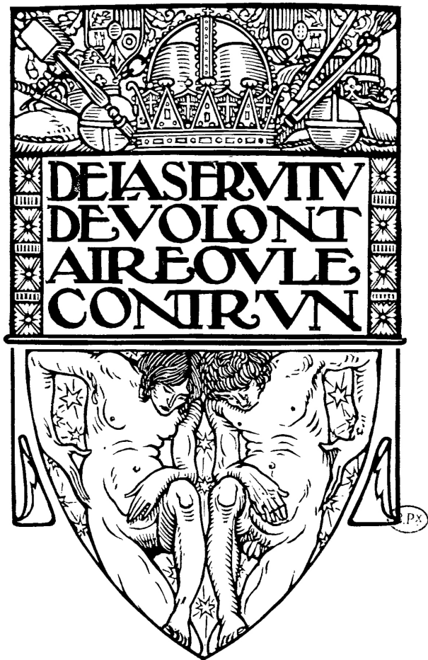
Izdanje Rasprave o dobrovoljnom ropstvu iz 1922, sa ilustracijama Luja Žua (Louis Jou).