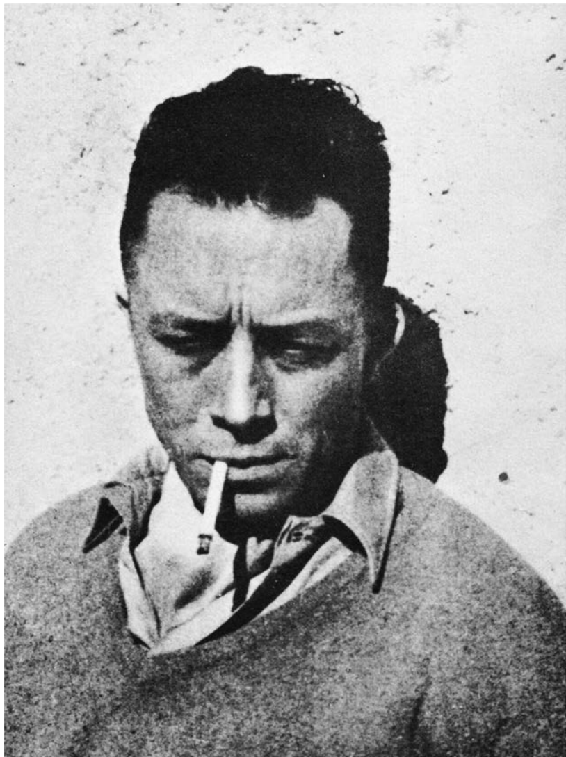
Albert Camus 1958