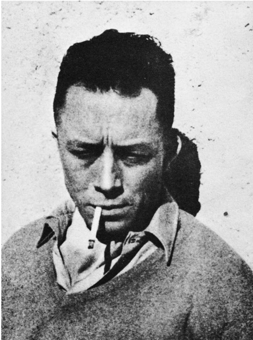
Albert Camus 1958