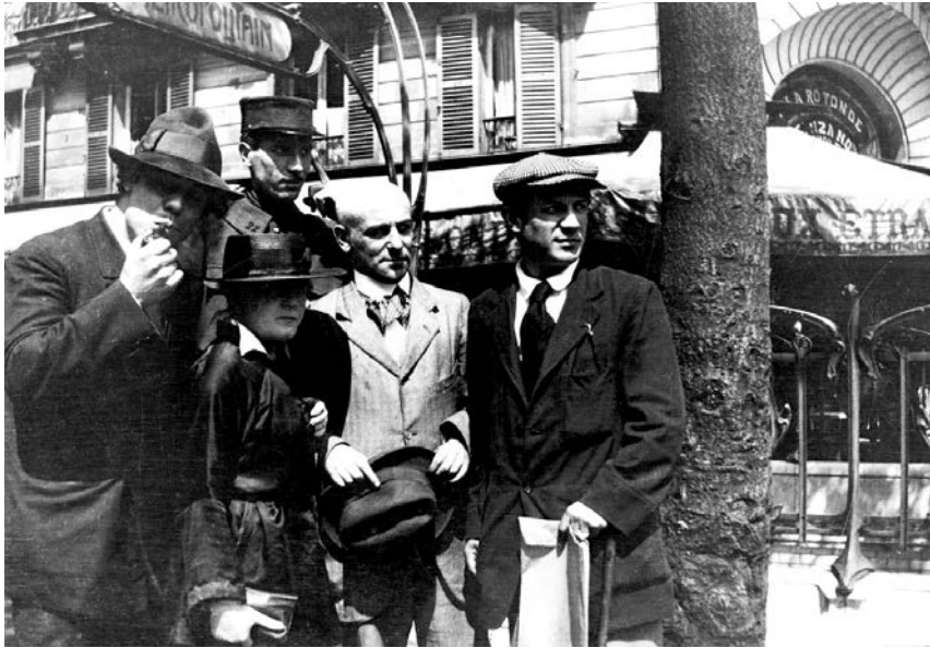
Manuel Ortiz de Zárate (slikar), Henri-Pierre Roché (autor romana Žil i Džim , u uniformi policajca), Marie Vassilieff (slikarka), Max Jacob (pesnik) i Pablo Picasso. Foto: Jean Cocteau, Paris, Montparnasse, 1916.

samo podgrejana renesansa – izaziva osećanje sterilnosti čak i kod najbezazlenijih ljudi. To doprinosi legendi o dvadesetim kao vremenu u kojem je posrnulo carstvo duha i dalje polagalo pravo na stari značaj u životima ljudi. Činjenica da je posle 1918. kubizam izgubio privlačnost, svakako je simptom koji se može dijagnostikovati samo post mortem . Kanvajler prenosi: „Pikaso mi i danas često kaže kako je sve što je urađeno između 1907. i 1914. moglo nastati samo kroz zajednički rad. Biti izolovan, biti sam, mora da ga je strašno uznemiravalo, a upravo tada je to počelo da se menja.“ 10 Izolacija koja je uništavala kontinuitet slikarevog dela i koja nije samo njega primoravala na revizije, teško da je bila biografski nasumična sudbina. Došlo je do očigledne erozije kolektivnih energija koje su proizvele najveće inovacije u evropskoj umetnosti. Promena odnosa između