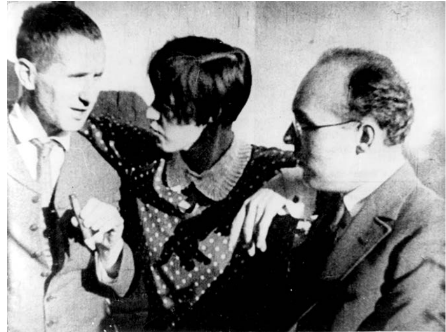
Bertolt Brecht, Lotte Lenya i Kurt Weill, 1929.

ima šanse da stvori nešto što neće biti izlišno. Svaka briga oko posledica, čak i pod izgovorom društvene funkcije ili iz obzira prema takozvanom ljudskom biću, ništavna je; baš kao i visokoparnost subjekta i njegovog izraza, iz herojskih dana moderne umetnosti. Više se nigde, u bilo kojoj umetnosti, kao takvoj, ne može umaći njenoj paradoksalnoj strani; taj paradoks, a ne neka egzistencijalna filozofema, jeste pravo značenje poštalice „apsurdno“. U svakom od tih momenata, savremeno stvaralaštvo mora imati na umu krizu smisla; kako smisla koji se subjektivno pridaje nekom umetničkom delu, tako i smislenog oblikovanja sveta. U suprotnom, samo stupa u službu opravdanja. Danas su, kao smisljena, legitimna samo ona umetnička dela koja se na najoštrij način suprotstavljaju konceptu smisla.