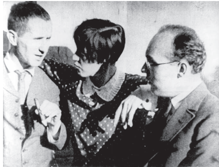
Bertolt Brecht, Lotte Lenya i Kurt Weill, 1929.

ima šanse da stvori nešto što neće biti izlišno. Svaka briga oko posledica, čak i pod izgovorom društvene funkcije ili iz obzira prema takozvanom ljudskom biću, ništavna je; baš kao i visokoparnost subjekta i njegovog izraza, iz herojskih dana moderne umetnosti. Više se nigde, u bilo kojoj umetnosti, kao takvoj, ne može umaći njenoj paradoksalnoj strani; taj paradoks, a ne neka egzistencijalna filozofema, jeste pravo značenje poštalice „apsurdno“. U svakom od tih momenata, savremeno stvaralaštvo mora imati na umu krizu smisla; kako smisla koji se subjektivno pridaje nekom umetničkom delu, tako i smislenog oblikovanja sveta. U suprotnom, samo stupa u službu opravdanja. Danas su, kao smisljena, legitimna samo ona umetnička dela koja se na najoštriji način suprotstavljaju konceptu smisla.