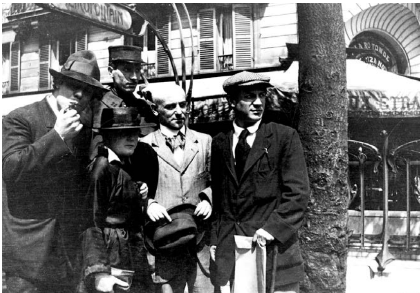
Manuel Ortiz de Zárate (slikar), Henri-Pierre Roché (autor romana Žil i Džim , u uniformi policajca), Marie Vassilieff (slikarka), Max Jacob (pesnik) i Pablo Picasso. Foto: Jean Cocteau, Paris, Montparnasse, 1916.

samo podgrejana renesansa – izaziva osećanje sterilnosti čak i kod najbezazlenijih ljudi. To doprinosi legendi o dvadesetim kao vremenu u kojem je posrnulo carstvo duha i dalje polagalo pravo na stari značaj u životima ljudi. Činjenica da je posle 1918. kubizam izgubio privlačnost, svakako je simptom koji se može dijagnostikovati samo post mortem . Kanvajler prenosi: „Pikaso mi i danas često kaže kako je sve što je urađeno između 1907. i 1914. moglo nastati samo kroz zajednički rad. Biti izolovan, biti sam, mora da ga je strašno uznemiravalo, a upravo tada je to počelo da se menja.“ 10 Izolacija koja je uništavala kontinuitet slikarevog dela i koja nije samo njega primoravala na revizije, teško da je bila biografski nasumična sudbina. Došlo je do očigledne erozije kolektivnih energija koje su proizvele najveće inovacije u evropskoj umetnosti. Promena odnosa između